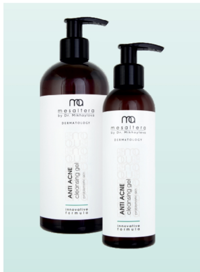
ANTI ACNE Cleansing gel 200 ml | 400 ml