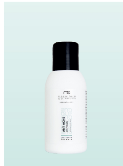
ANTI ACNE Complex | 100 ml

Предназначен для очищения, тонизации и ухода за жирной и проблемной кожей с акне. Салициловая кислота обеспечивает эксфолилирующее действие, размягчает комедоны. Комплекс Ac.Net™ блокирует причины возникновения акне и комедонов, борется с гиперпродукцией кожного себума. Комплекс Trikenor™ Plus обладает антимикробным и успокаивающим действием. Panthenol и Allantoin увлажняют, смягчают и успокаивают, способствуют обновлению кожи. Не содержит спирта, не сушит кожу.